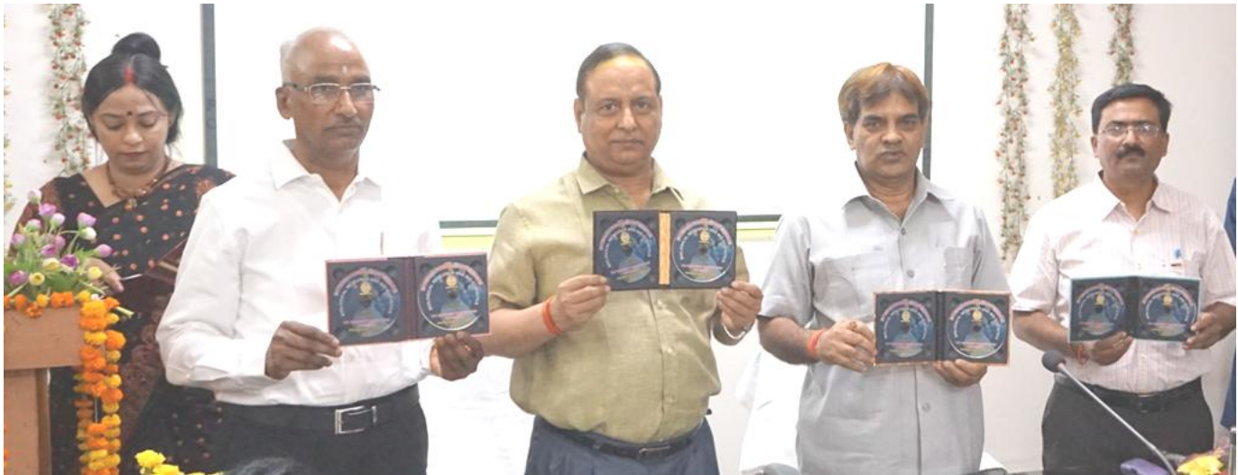
ई-सोविनियर का विमोचन करते हुए माननीय अतिथि