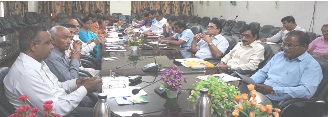
बैठक में उपस्थित सभी क्षेत्रीय केन्द्र समन्वयक, प्रवेश प्रभारी, परीक्षा नियंत्रक, पाठ्य सामग्री प्रभारी एवं विश्वविद्यालय के निदेशकगण