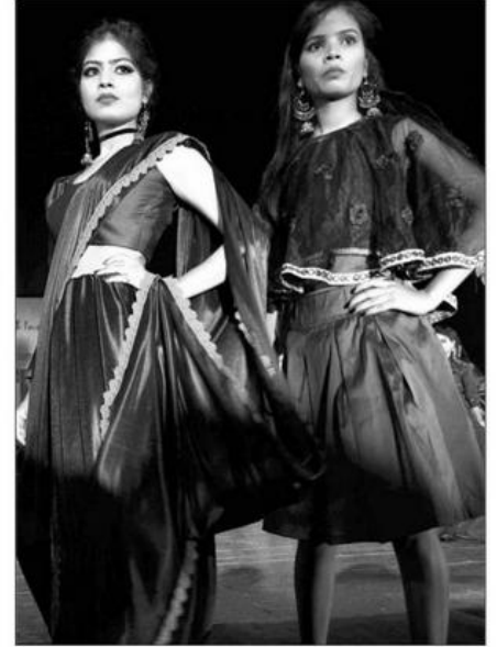
उत्तर मध्य क्षेत्र सांस्कृतिक केंद्र में रुचीज इंस्टीट्यूट की ओर से शनिवार को आयोजित फैशन शो में रथ पर कैटवाँक करती मॉडल। 08/11/2024

प्रयागराज। रुचीज इंस्टीट्यूट ऑफ क्रिएटिव आर्ट्स की ओर से शनिवार को एनसीजेडसीसी के प्रेक्षागृह में वार्षिक परिधानों की आकर्षक प्रस्तुति संस्थान के छात्र-छात्राओं की ओर से की गई। इस दौरान 130 छात्र-छात्राओं ने 300 परिधानों को पहनकर कैटवाँक किया।