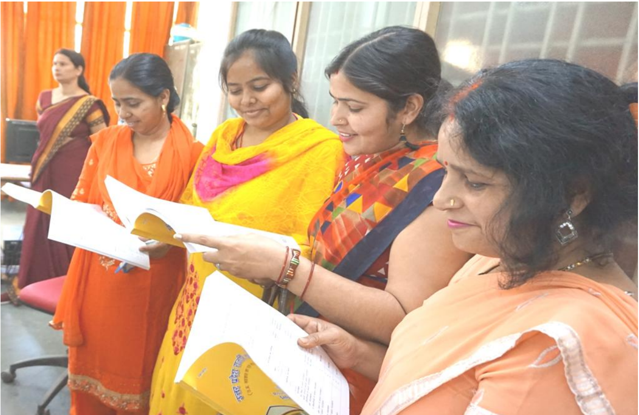
प्रवेश विवरणिका का अध्ययन करती हुई छात्रायें