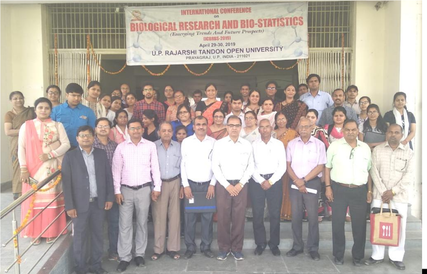
ग्रुप फोटोग्राफी करते हुए प्रतिभागीगण।