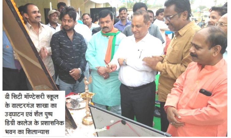
दी सिटी मॉण्टेसरी स्कूल के वाल्टरगंज शाखा का उद्घाटन एवं शैल पुष्प डिग्री कालेज के प्रशासनिक भवन का शिलान्यास