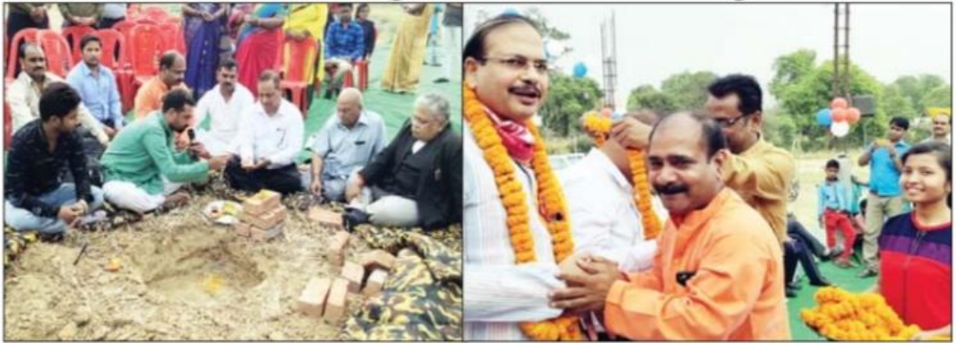
शिलान्यास करते कुलपति व अतिथियों का स्वागत करते प्रबंधक।

दी सिटी माण्टेसरी स्कूल के वाल्टरगंज शाखा का उद्घाटन एवं शैल पुष्प डिग्री कालेज के प्रशासनिक भवन का शिलान्यास