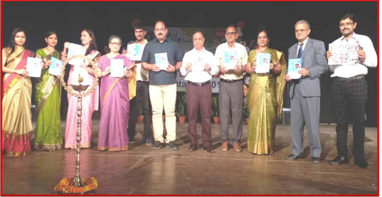
वार्षिक सूचना पत्रिका का विमोचन करते हुए माननीय अतिथिगण।