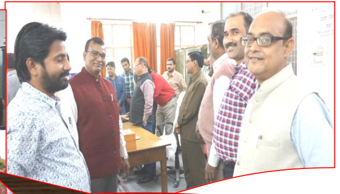
कार्यक्रम में उपस्थित विश्वविद्यालय के निदेशक, अधिकारी, शिक्षक, छात्र-छात्रायें एवं कर्मचारीगण।