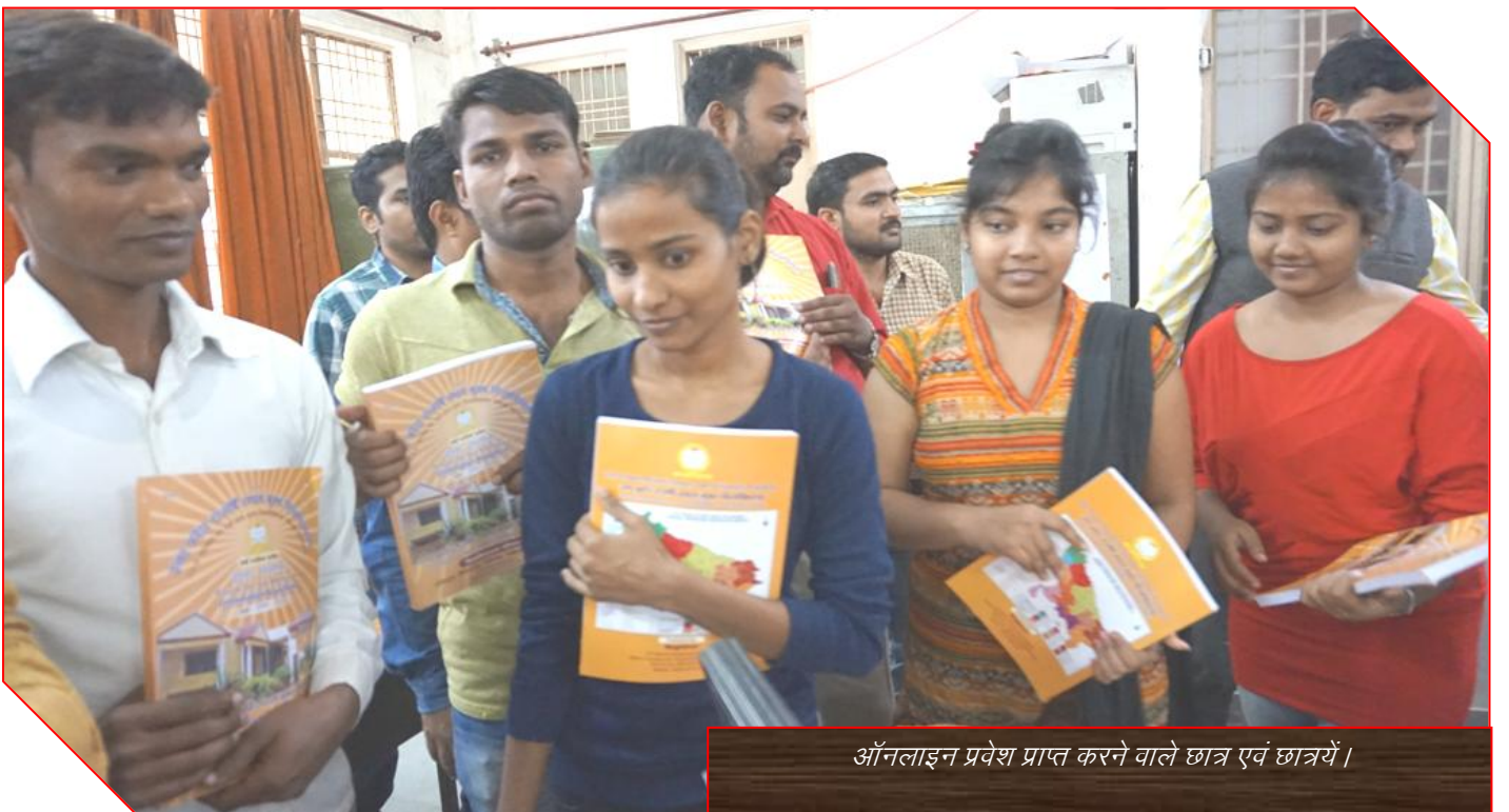
ऑनलाइन प्रवेश प्राप्त करने वाले छात्र एवं छात्रयें ।