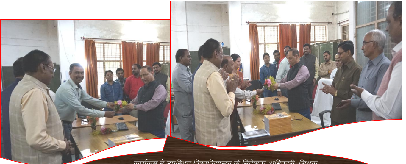
कार्यक्रम में उपस्थित विश्वविद्यालय के निदेशक, अधिकारी, शिक्षक, छात्र-छात्रायें एवं कर्मचारीगण।