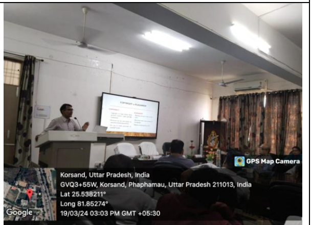
Korsand, Uttar Pradesh, India GVQ3+55W, Korsand, Phaphamau, Uttar Pradesh 211013, India Lat 25.538211° Long 81.85274° 19/03/24 03:03 PM GMT +05:30 Google