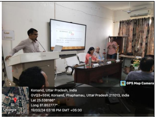
GPS Map Camera Korsand, Uttar Pradesh, India GVQ3+55W, Korsand, Phaphamau, Uttar Pradesh 211013, India Lat 25.538186° Long 81.852777° 19/03/24 03:18 PM GMT +05:30 Google