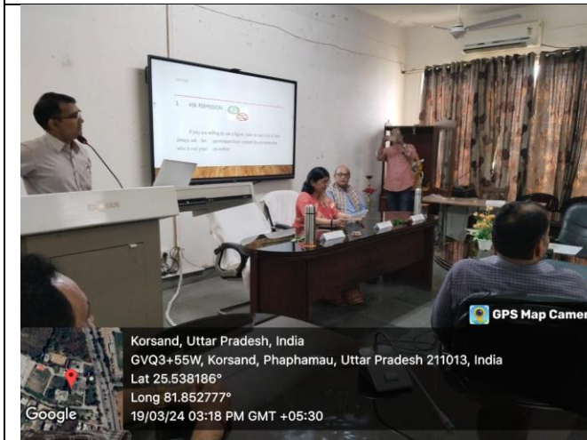
GPS Map Camera Korsand, Uttar Pradesh, India GVQ3+55W, Korsand, Phaphamau, Uttar Pradesh 211013, India Lat 25.538186° Long 81.852777° 19/03/24 03:18 PM GMT +05:30 Google