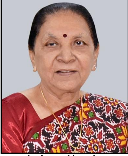
श्रीमती आंनदीबेन पटेल माननीया कुलाधिपति, उत्तर प्रदेश