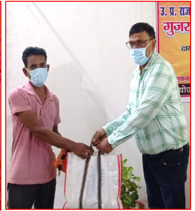
क्षय रोग पीड़ितों को पोषण पोटली वितरण करते हुए विश्वविद्यालय के शिक्षकगण